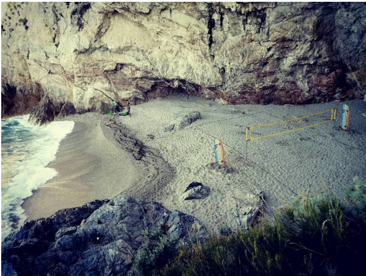
Il campo amovibile di beach volley a Punta Crena